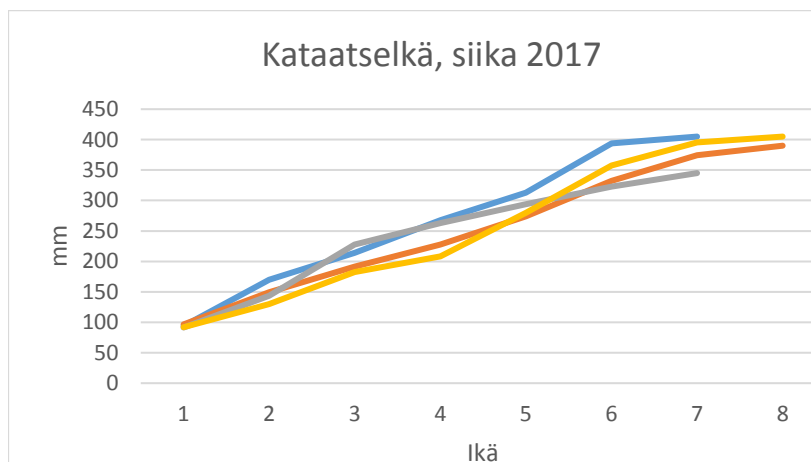
Kuva 2. Pohjois-Suonteen Kataatselän neljän siian kasvu. Näytteet kesältä 2017.

Aineistoa tulee kerätä enemmän ja suuremmista yksilöistä. Jos Etelä-Suonteen siikamuodot jatkavat kasvuaan iän karttuessa, kuten Pohjois-Suonteella, kannattaisi ne pyytää hieman suuremmilla solmuväleillä esim. 40 mm verkoilla. Saaliin kokojakaumasta voi olettaa saavan tietoa myös järven rysäkalastajilta. Yleisesti harvahampainen tuppisiika ei kasva kovin suureksi (usein vain 250-350 g), Keski-Suomessa järvisiika on paikoin kasvanut nopeasti, mutta nopeakasvuimpana pidetään yleensä planktonsiikaa, joka saattaa kärsiä hyvistä muikkukannoista istutusvesistössään.